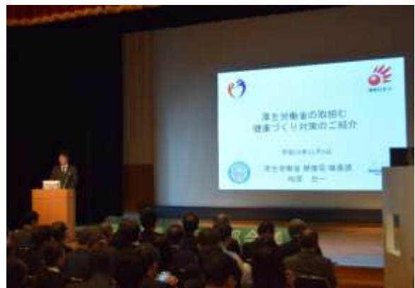
○来賓挨拶（厚生労働省）