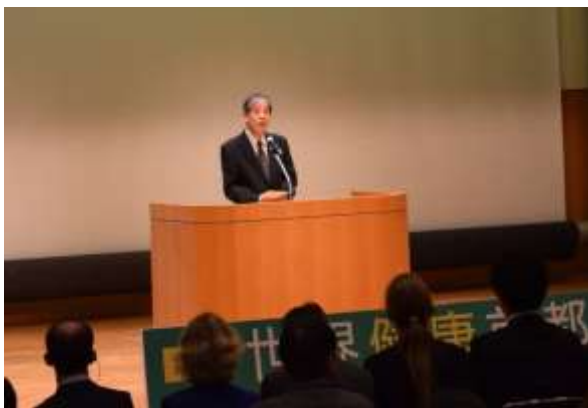
○実行委員会会長挨拶